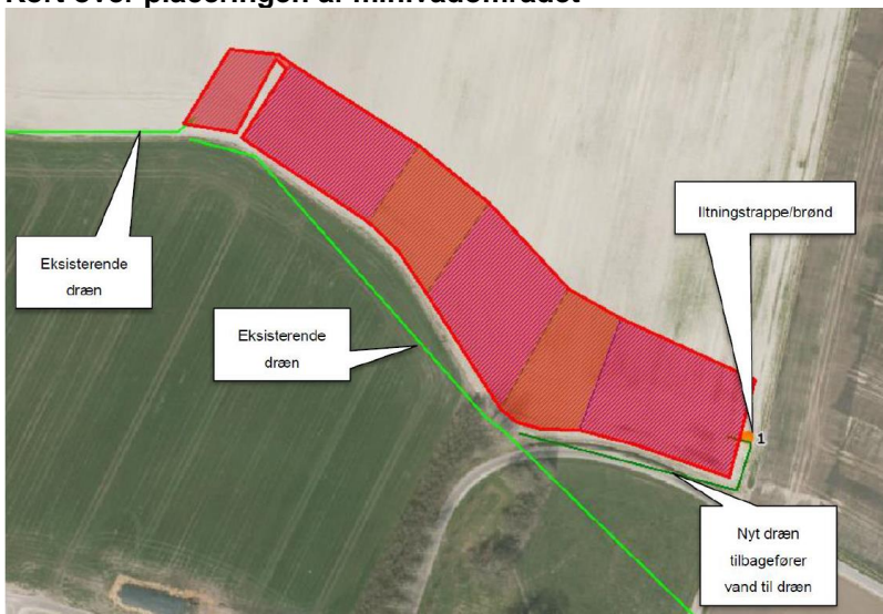
Nærmere kort over projektet.