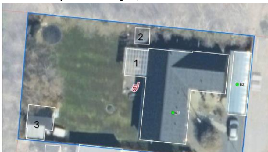
Figur 1: Ortofoto af matr.nr 5I – Vossevangen 7,7600 Struer. Bygning 1 ønskes omdannet til udestue, bygning 2 og 3 søges lovliggjort og B2 (Carport) søges ligeledes lovliggjort.

Struer Kommune meddeler hermed dispensation fra skovbyggelinjen til etablering af udestue på ejendommen (Bygning 1 – se nedenstående billede), samt lovliggørende dispensation fra skovbyggelinjen af bygning 2,3 og B2 / carport (markeret med grønt punkt) – se nedenstående billede, efter naturbeskyttelseslovens § 65, stk. 1.