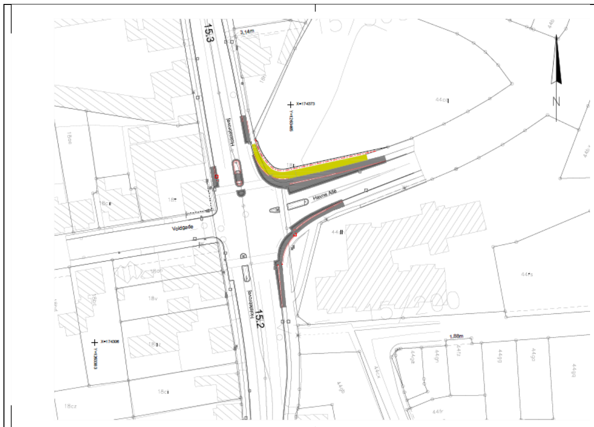
Plantegning over udbygning af kryds.